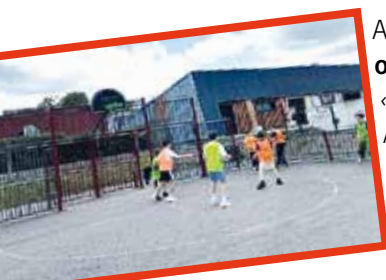
Tournoi des 3 ballons

Après s'être qualifiés à Rennes nos jeunes lasséens ont remporté le tournoi inter-communal de foot , « on prend les mêmes et on recommence ! ».