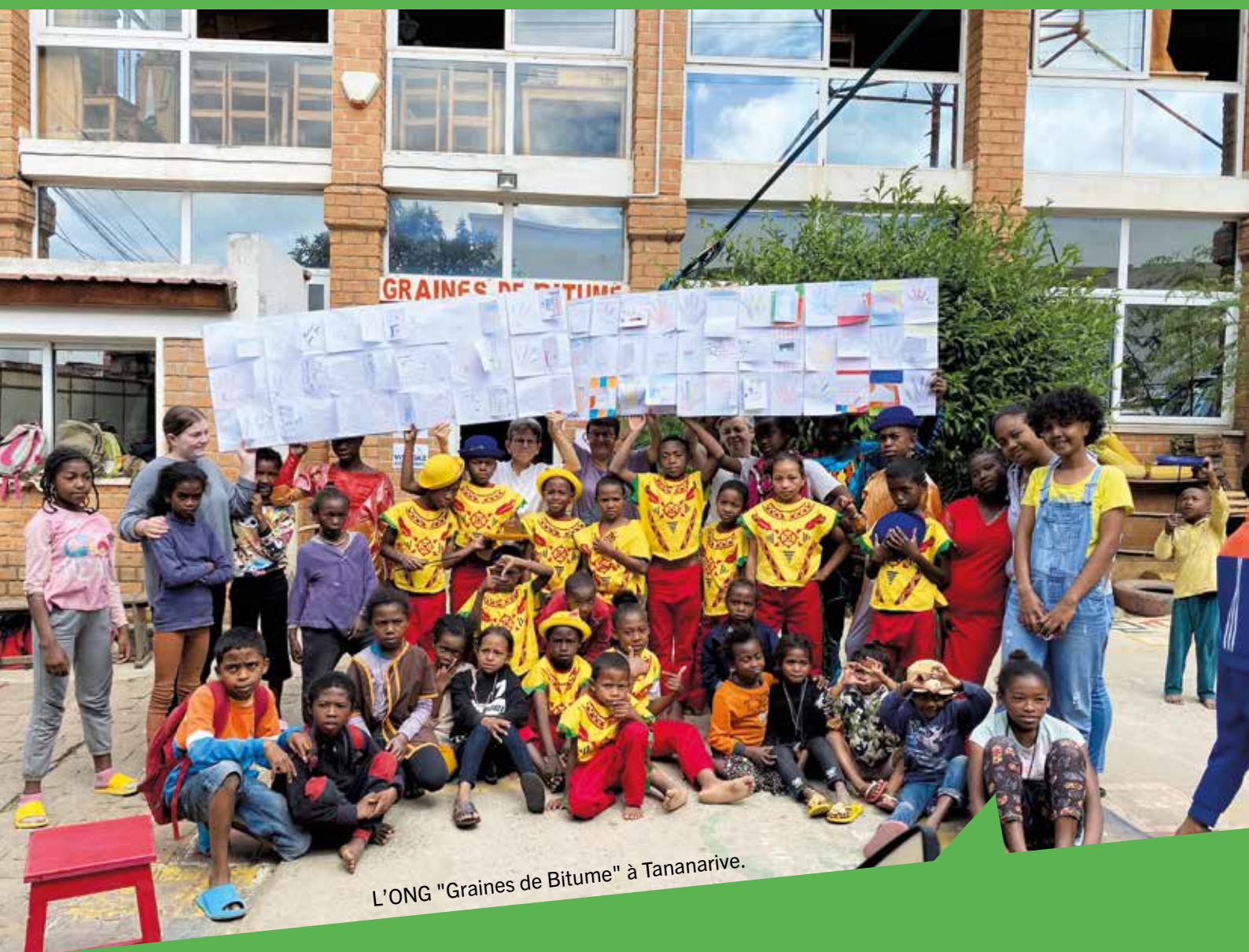
L'ONG "Graines de Bitume" à Tananarive.